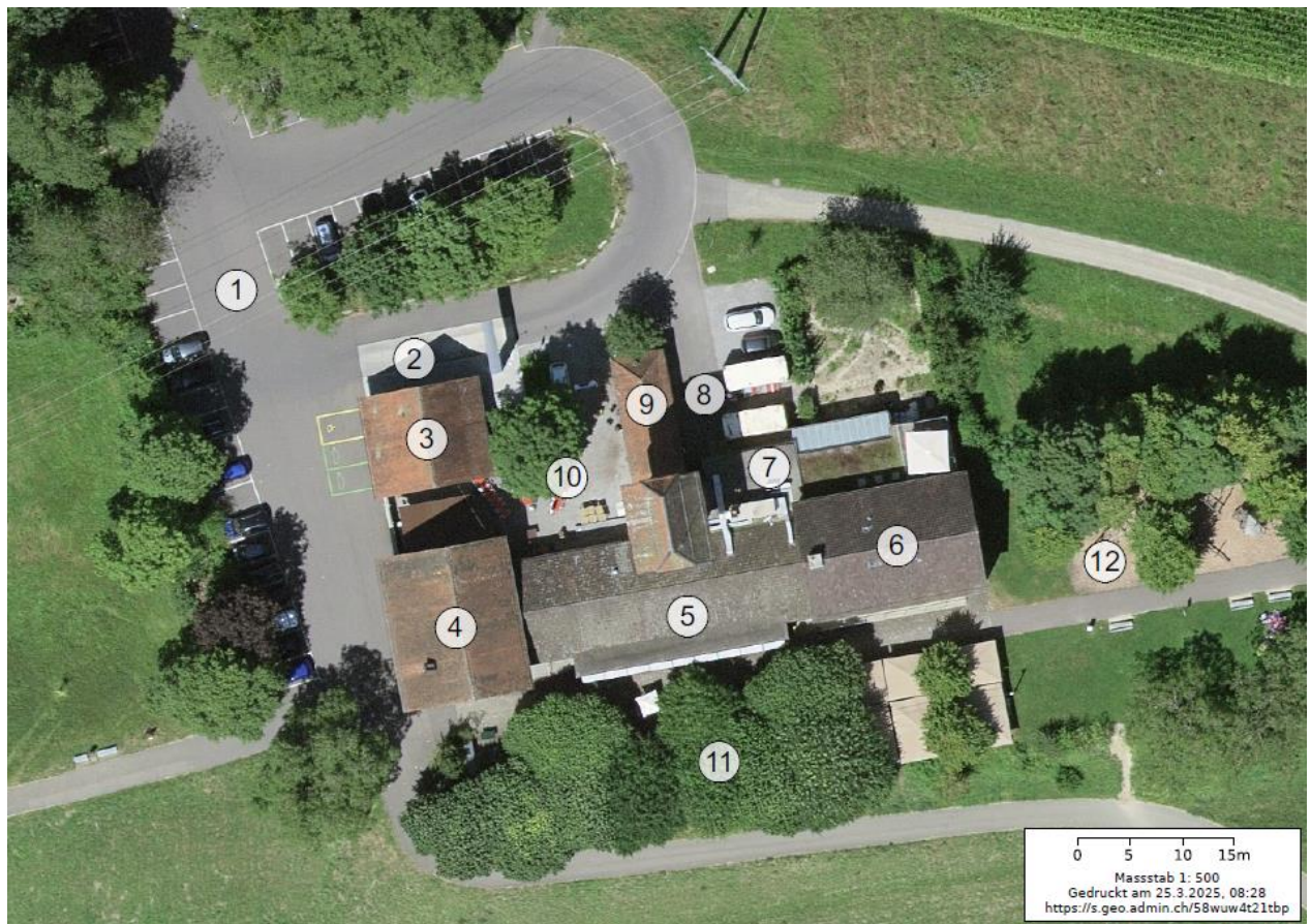
Abbildung 1: Übersicht Gesamtanlage

Am Ortsbürgerforum vom 18. Mai 2025 wurden die Ausgangslage und Zielsetzung interessierten Ortsbürgerinnen und Ortsbürgern erläutert und die zahlreichen Teilnehmenden nahmen die Möglichkeit wahr, den Betrieb und die betroffenen Räumlichkeiten zu begehren, Fragen zu stellen und sich persönlich ein Bild zu machen.